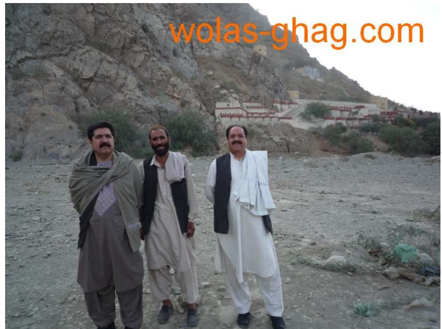
شهيد و طنوال، عبد النبي الهام او د و طنوال صاحب ډرايور گل، طورخم ۲۰۰۹ د اکتوبر ۲۲