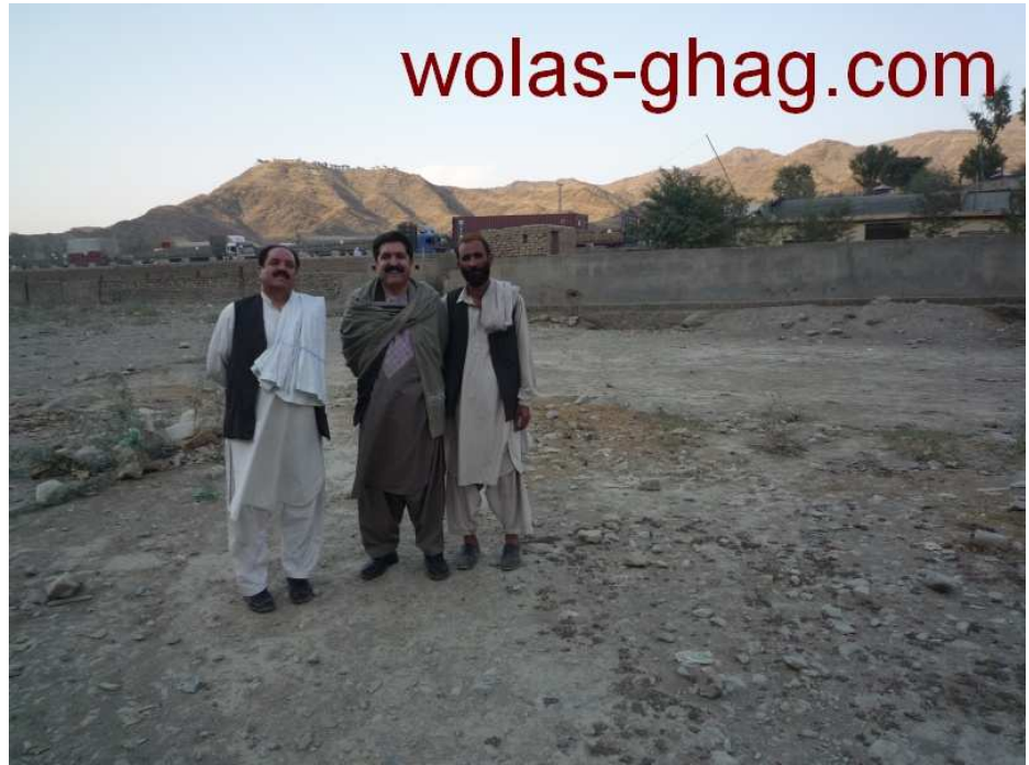
شهيد و طنوال، عبد النبي الهام او د و طنوال صاحب ډرايور گل، طورخم ۲۰۰۹ د اکتوبر ۲۲