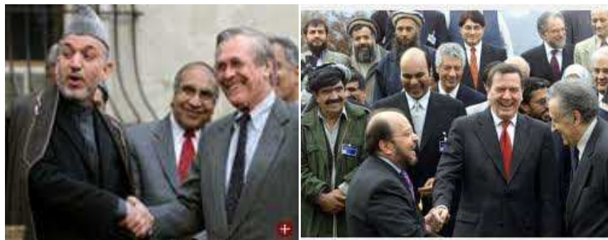
راغلي نا بللي دې خدای ژر له سيمې ورک کړي بسمله ملک زموږ خو ادارې پردی پردی دي