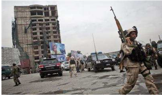
پرون يې د کرزي تر ډيره لاندې بار خړتېر کړ د اته څلو پښتو ملکو خو پهرې پردی پردی دي