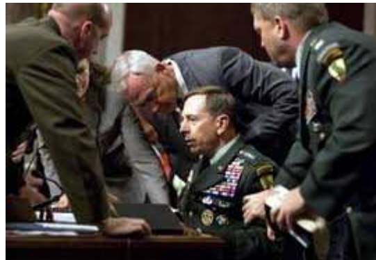
له سلو قصابانو غوا مرداره شوه هغه ورځ دوی هر یو ښه ماهر و خو چرې پردی پردی دي