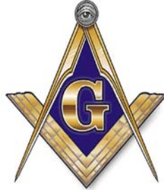
نماد پرکار و گونای ماسونی (به چشم جهان بین روی پرکار دقت کنید).