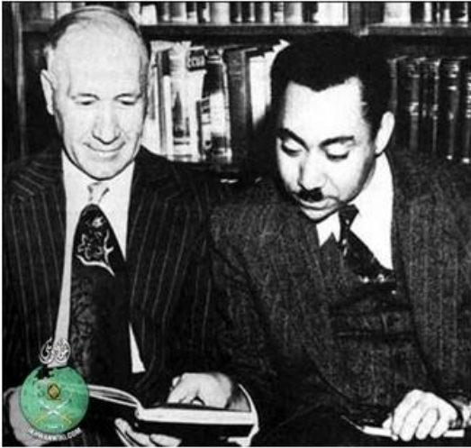
اديب سيد قطب

کوله. په کال ۱۹۳۳ز کې د مصر د ښوونې او روزنې د وزارت له لورې د