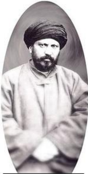
افغان سيد جمال الدين

اسلامي وينتابه چې په عربي کې ورته الصحوه الاسلاميه وايي، په هغه حالت کې چې د اسلام سم مفهوم نه وي پاتې، د اسلام اصیل فهم رامنځته کول، قرآن او صحیحو احاديثو ته رجوع کولو ته اسلامي وينتابه وايي. 2