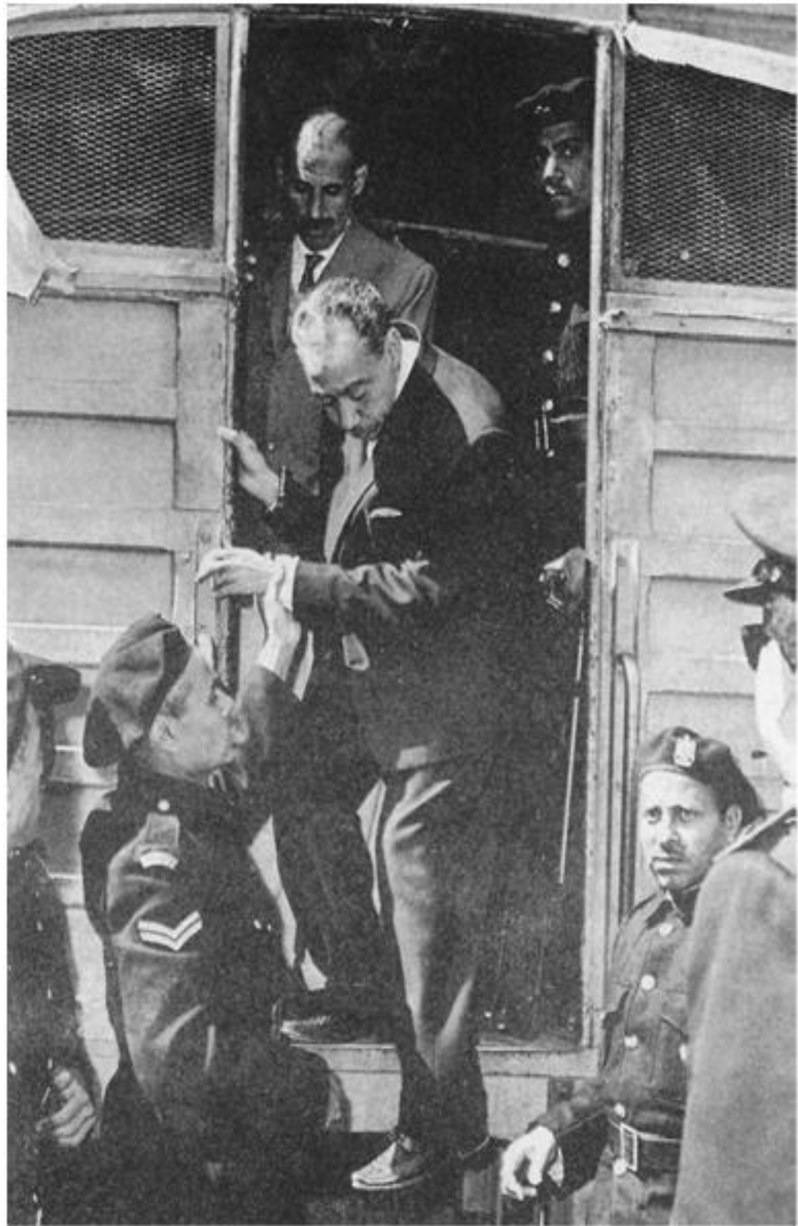
سید قطب او یوسف هوش د محکمی پر لور