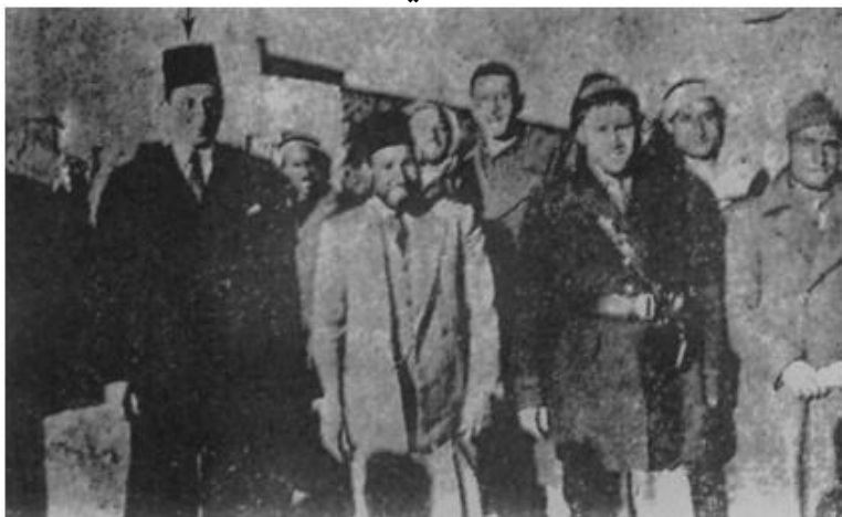
امام حسن البنا په فلسطين کې له استاذ سباعي، عمر بها الدين او نورو ملگرو سره

امام حسن البنا د فلسطين د آزادۍ لپاره جهاد شروع کړ او د صهيونستي ځواکونو په مقابل کې د اخوان المسلمین ځوانو مجاهدينو ډېر په اخلاص و جنگېدل. يهودو ته يې غټه ضربه ورسوله، يهود ډېر وارخطا شول، صهيونستانو د غرب له لارې د مصر په حکومت فشار راوړ، چې د اخوان المسلمین مشران شهيدان او بنديان کړي او دا مبارک حرکت لمنځه يوسي.